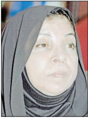
● تناضر السديراوي

كتب محسن الهيلم: تواصل لجان مقابلات الوظائف الاشرافية للمعلمين والمعلمات اعمالها بعد ان احتاز المتقدمون الاختبارات التحضيرية في مدرسة ابن رشد بالفحاء، وقالت مصادر تربوية ان المئات يرضعون للمقابلات من قبل لجان مختصة بالتربية. وأضافت المصادر ان المقابلات ستستمر اكثر من شهر لوجود اعداد كبيرة من المترقبين للوظائف الاشرافية.