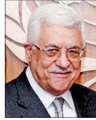
● محمود عباس

الطيب: من الكويت انطلقت فتح ومنها نتلقى الدعم وصولاً لإقامة الدولة